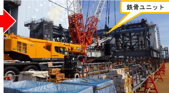
(写真1-2) 2号機原子炉建屋南側ヤードの概観 (今回(3月16日)南西側から撮影)