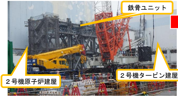
(写真1-1) 2号機原子炉建屋南側ヤードの概観 (前回(2月10日)南西側から撮影)