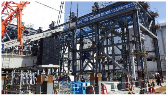
(写真1-3) 構台部の鉄骨ユニットの状況①(南西側から撮影)