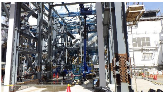
(写真2) 高所作業車での鉄骨ユニットの建方作業の状況

5 プラント関連パラメータ等確認 本日確認したデータについて、異常な値は確認されなかった。