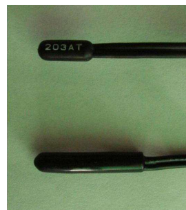
図1 樹脂製の汎用センサー