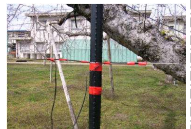
図2 温度センサーの設置方法