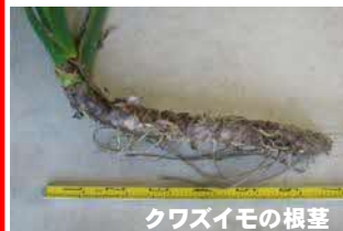
クワズイモの根茎