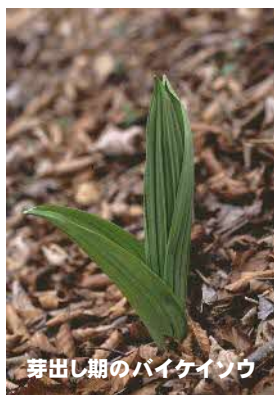
芽出し期のバイケイソウ