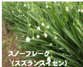
スノーフレーク (スズランスイセン)