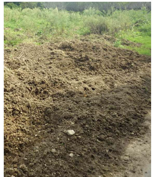
大規模な掘り返しを見る機会も少ない

これまで行ってきた対策を継続するとともに、集落柵の設置や地域で協力して行う広範囲の刈払いなど、手をつけられていない大規模な対策を今のうちに進めておくことも重要です。