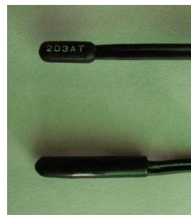
図1 樹脂製の汎用センサー