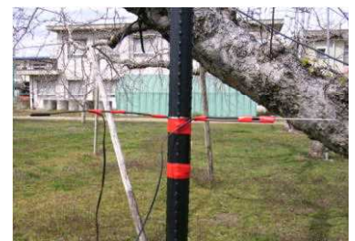
図2 温度センサーの設置方法