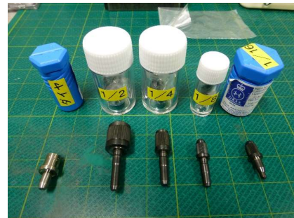
各スケールの圧子