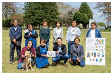
岩瀬牧場スタッフの皆さん

岩瀬牧場では、動物とのふれあいをはじめ、ツリーハウス、フラワーガーデンなどのレジャーをお楽しみいただけます。近年ではイベントに力を入れており、特に夏季限定の「とうもろこし巨大迷路」は大変好評で、コロナ禍でも多くの方楽しんでいただきました。