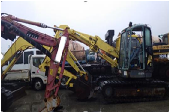
(写真3) 重機の保管状況