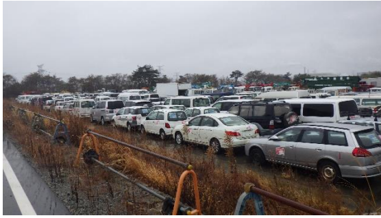
(写真1) 使用禁止車両の保管状況