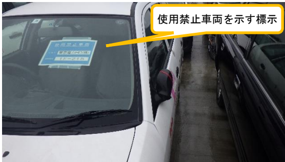
(写真2) 使用禁止車両を示す標示の状況