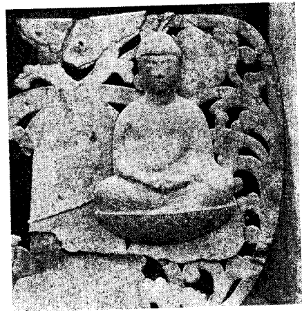
羽山の御神体の懸仏

さまを移すようにとのご託宣があり、昭和四十三年に遷宮祭をして鎮守（村氏神）の水神社の境内に合祀した。このほかに御神体として黄金の牛の寝ている像もあったとの伝承もある。