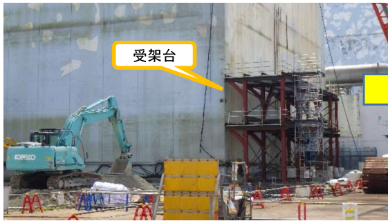
(写真1-1) アンカー掘削装置の受架台設置状況 (令和3年8月30日撮影)