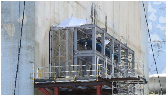
(写真1-3) アンカー削孔装置 (拡大)