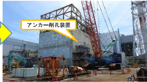
(写真1-2) アンカー削孔装置の据え付け状況 (令和3年9月10日撮影)