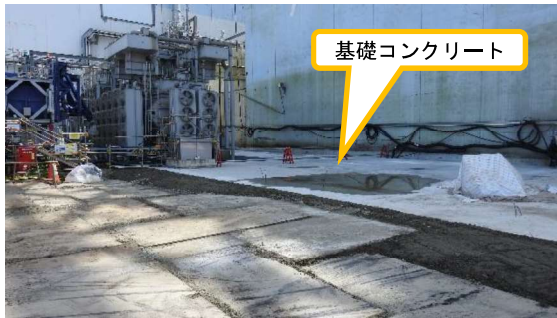
(写真2) 原子炉建屋北側のコンクリート基礎 工事の状況