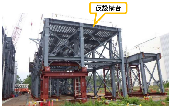
(写真1-2) 仮設構台の地組状況② (ヤード北側を南東側から撮影)