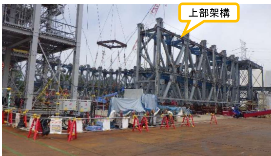
(写真 3 - 1) 上部架構の地組状況① (ヤード中央部を南東側から撮影)