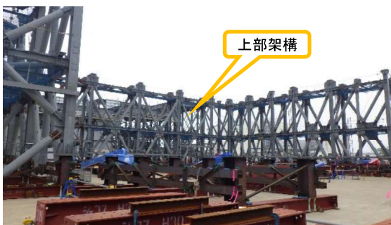
(写真 3 - 2) 上部架構の地組状況② (ヤード中央部を西側から撮影)