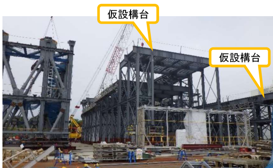
(写真1-1) 仮設構台の地組状況① (ヤード北側を南東側から撮影)