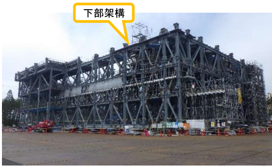
(写真 2 - 1) 下部架構の地組状況① (ヤード南側を北東側から撮影)