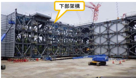
(写真 2 - 2) 下部架構の地組状況② (下部架構内部を南東側から撮影)