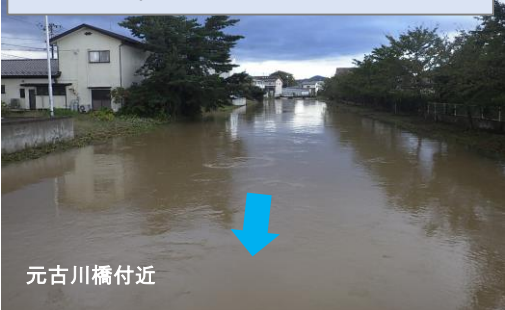
令和元年東日本台風時の出水状況

伊達市保原町を流れる古川の沿川地域は、令和元年の東日本台風の豪雨をはじめ、これまでに度重なる浸水被害が発生しており、地域の方々から、早期の河川改修の声が寄せられています。