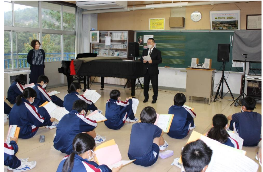
高郷中学校（音楽：声楽）