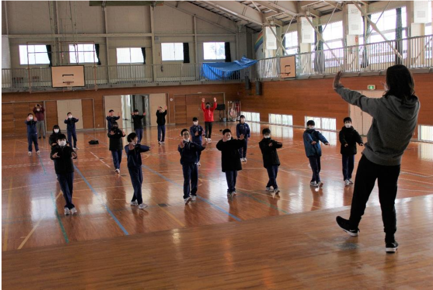
会北中学校（保健体育：ダンス）