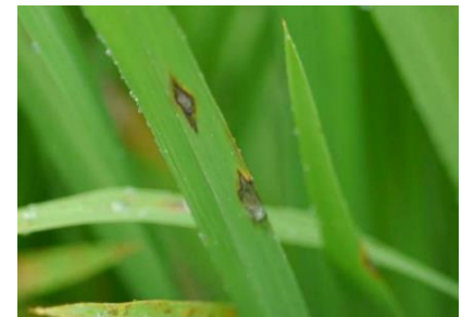
図2: 葉いもちの病斑