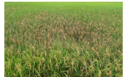
図3: 穂いもち発生ほ場