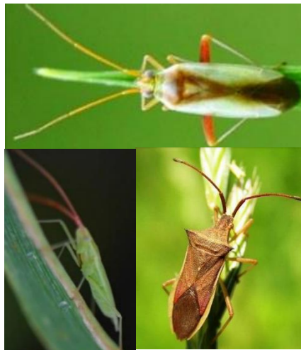
図4: 会津管内の主な斑点米カメムシ アカスジカスミカメ(上)、アカヒゲホソドリカスミカメ(左下)、ホソハリカメムシ(右下)