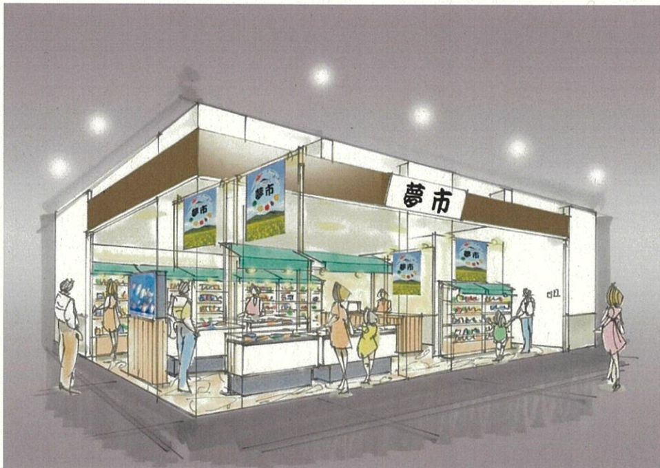
「三陸常磐 夢市」 イメージ図