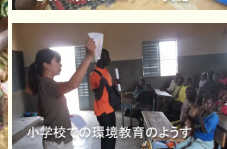
小学校での環境教育の様子