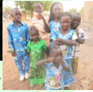
クリスマスのための現地布でつくった服をみんな身につけます。町中、この水色一色に！