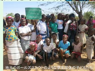
地元のガールズスカウトのような学生団体の子どもたち