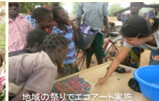
地域の祭りでエコアート実施