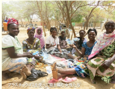
プラスチックゴミを使って籠を編む女性たち