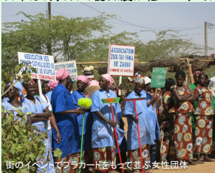
街のイベントでプラカードをもって並ぶ女性団体