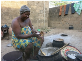
朝からたくさんの米ボール(こちらのこちそう)を作り、近所の人にお裾分け。各家庭の料理を交換するのがクリスマスの習慣。