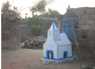
12月に入ると、キリスト教のお家の入り口付近に増えてくるミニハウス。キリストが産まれた馬小屋を表していて、どの家にもキリストが舞い降りるようにという願いが込められているそうです。一軒一軒、子どもとお父さんが一緒に手作りで作ります。

ブルキナファソの年間行事(祝日)は左のとおり。(ちなみにマークはキリスト教のイベント、マークはイスラム教のイベント。※は変動あり)季節の行事...と紹介しましたが、ほとんどが宗教の行事。比べてみて、日本はいかに暦(四季)の行事が多いかがわかりますね。今回は、キリスト教徒の多いココーベラで盛りあがった“クリスマス”の過ごし方について紹介します。