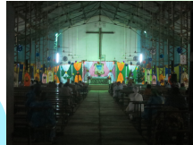
24日夜19:00頃から翌朝2:00頃まで行われるミサ。教会もきれいに飾り付け。