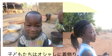
子どもたちはオシャレに飾り。上の写真は頭に黒墨を塗っている子。右は普段つけないエクステ(つけ毛)をつけてオシャレする子。