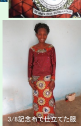
3/8記念布で仕立てた服