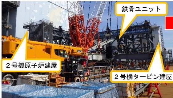
(写真1-1) 2号機原子炉建屋南側ヤードの概観 (前回(3月16日)南西側から撮影)