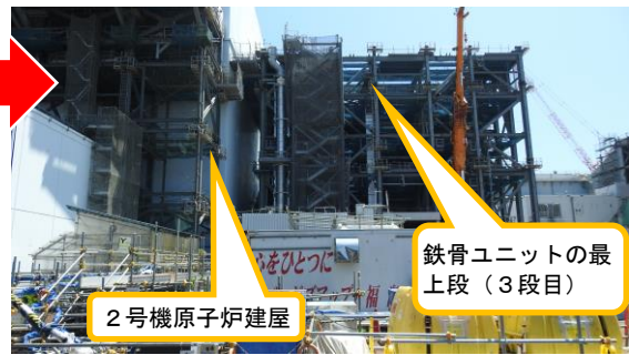
(写真1-2) 同建屋南側ヤードの概観 (今回(7月28日)西側から撮影)