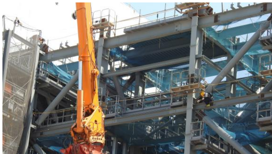
(写真2) 鉄骨ユニット最上段における建方作業の状況(南西側から撮影)