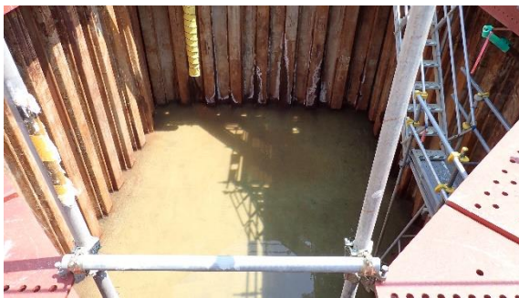
(写真 3 - 1) 発進立坑内部の状況 (西側から撮影)