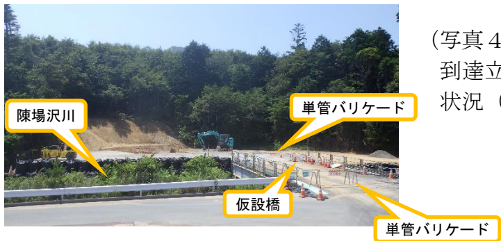
(写真4) 到達立坑設置場所付近の工事区画の 状況（北側から撮影）