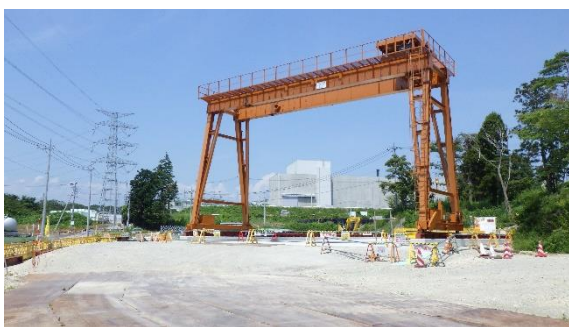
(写真 3 - 2) 発進立坑設置場所付近の工事区画の 状況③ (東側から撮影)