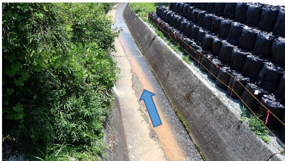
(写真1-2) 陳場沢川の状況② (到達立坑設置場 所付近北側を北西側から撮影)