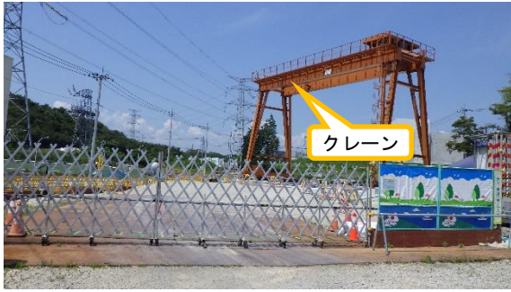
(写真 2 - 1) 発進立坑設置場所付近の工事区画の 状況① (東側から撮影)