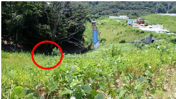
(写真1-1) 陳場沢川の状況① (発進立坑設置場 所付近西側を北西側から撮影)