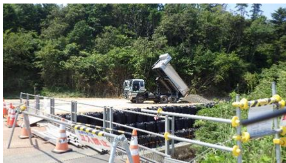
(写真5) 到達立坑設置場所付近工事区画への 砕石搬入状況（北側から撮影）