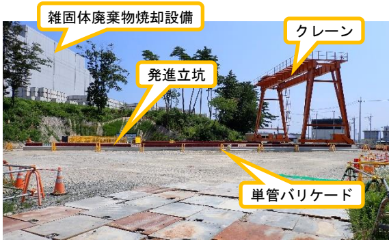
(写真 2 - 2) 発進立坑設置場所付近の工事区画の 状況② (西側から撮影)