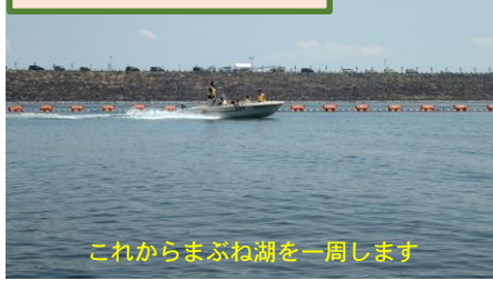
まぶね湖巡視体験