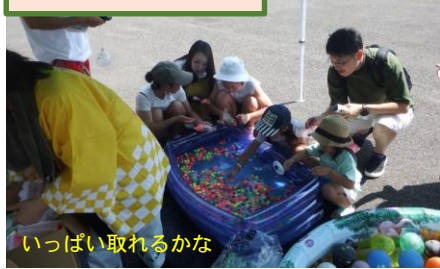
ヨーヨー釣り スーパーボールすくい