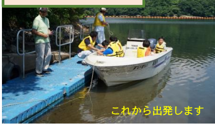
まぶね湖巡視体験