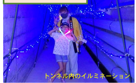
ダムトンネル見学