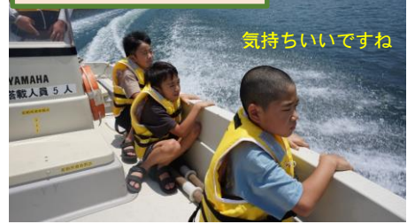
まぶね湖巡視体験