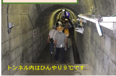
ダムトンネル見学