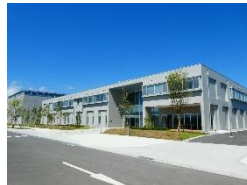
福島ロボットテストフィールド