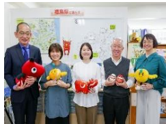
ふるさと福島就職情報センター 東京窓口