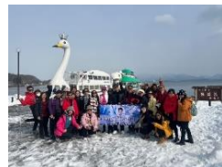
海外インフルエンサー 招聘の様子