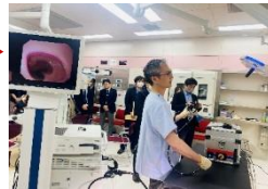
県内企業が開発に関わった次世代医療機器