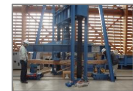
《オープンラボラトリーの利用風景(実大曲げ試験)》