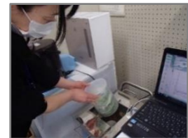
《NaIシンチレーションスペクトロメータによる山菜の放射性物質濃度の測定》