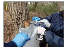
《放射性物質濃度測定 試料採取》