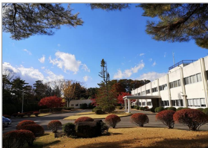
《 林業研究センター 本館 》