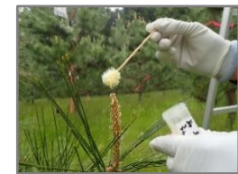
《クロマツ交配試験》