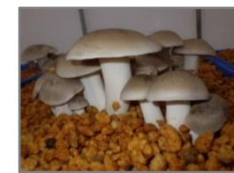
《ほんしめじ福島H106号》