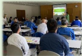
カゴメ(株)健康セミナー