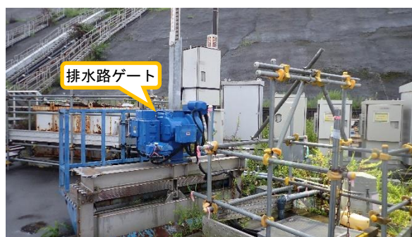
(写真2) 排水路ゲートの設置状況