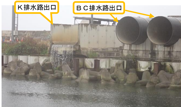
(写真 4) K排水路及びB C排水路の出口 の状況