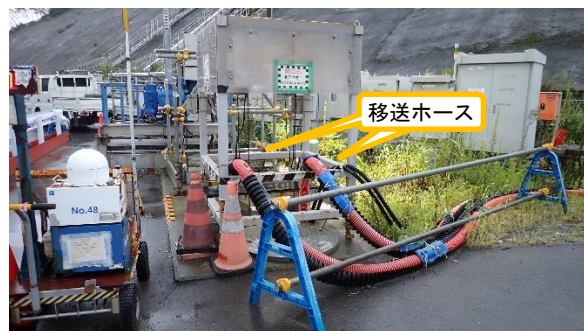
(写真3-1) 移送ホースの設置状況①