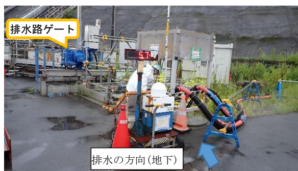
(写真1) K排水路P S F モニタ周辺の状況 (P S F モニタは地下排水路に設置されている)