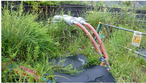
(写真 3 - 2) 移送ホースの設置状況②