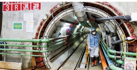
放水トンネル内部を確認する駐在職員

ALPS処理水希釈放出設備設置に伴う、放水トンネル、関連設備の設置状況及びALPS処理水の移送配管の設置状況について、現場の確認を行いました。