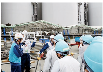
第8回 安全確保技術検討会(現場調査)の様子(令和5.3.23開催)

※原発事故の影響が広範囲に及んだことを踏まえて、立地町以外の周辺市町村(11市町村)とも、協定を締結しています。また、福島第二原子力発電所においても、県、立地町(楢葉町、富岡町)の3者で安全確保協定が締結されています。