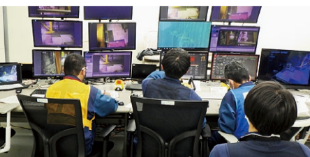
機器取り出し用クレーンの遠隔操作を確認する様子