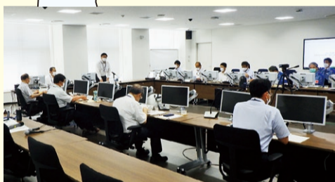
令和4年度第2回協議会の様子(R4.7.26開催)