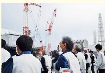
令和4年度第4回 廃炉安全確保県民会議(現地調査)の様子(R5.3.22)

会議では県民の代表が、国や東京電力に直接意見をを行っているほか、会議の様子は本課YouTubeチャンネルでライブ配信しています。令和4年度までの10年で計51回開催され、専門家の目線とは違う視点から廃炉作業の監視を行っています。