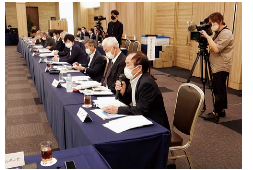
東京電力に対して質問をする構成員