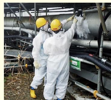
現地確認を行う様子

また、トラブル発生時の迅速な情報収集を行うため、休日・夜間も現地確認ができるように体制を整えています。