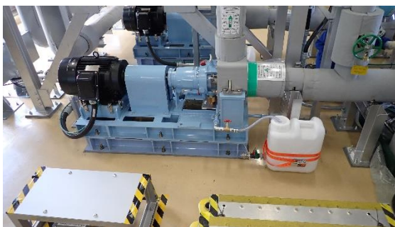
(写真2) 処理水移送ポンプ (B) の状況