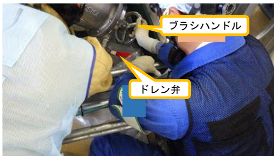
(写真4-2) ストレーナ清掃作業の状況