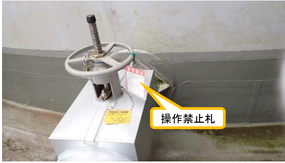
(写真1-2) C群タンク (C-1) 出口弁「全開」の状況