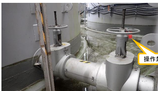
(写真1-1) C群タンク連結弁「全開」の例