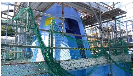
(写真3) 海水移送ポンプ (C) の状況