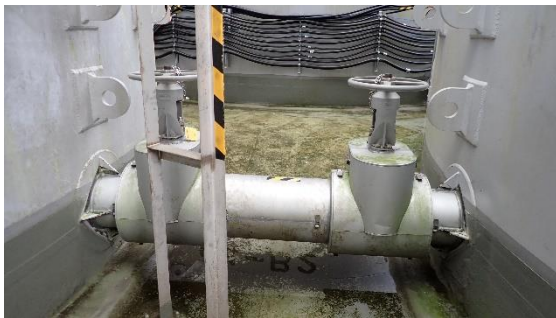
(写真1-3) B群タンク連結弁「全閉」の例