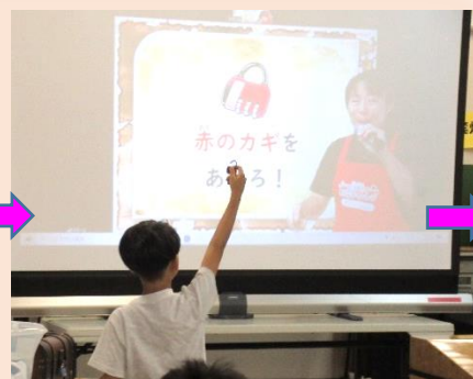
クイズに正解すると宝箱の鍵を手に入れることができます。