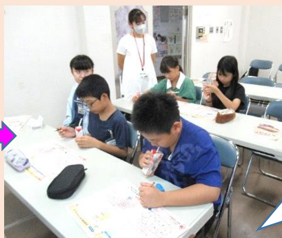
最後に野菜ジュースを飲んでどんな野菜が入っているか考えました。