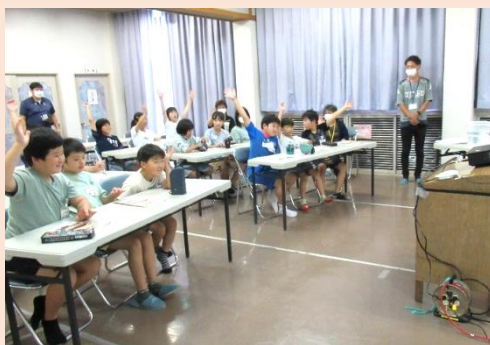
東京のスタジオとリモートで繋いで学習を行いました。

カゴメと放課後 NPO アフタースクールが、保護者・学校の「困りごと」であり、野菜不足要因の一つである「食経験による野菜嫌い」の克服を目指して開発した共同食育プロジェクトです。