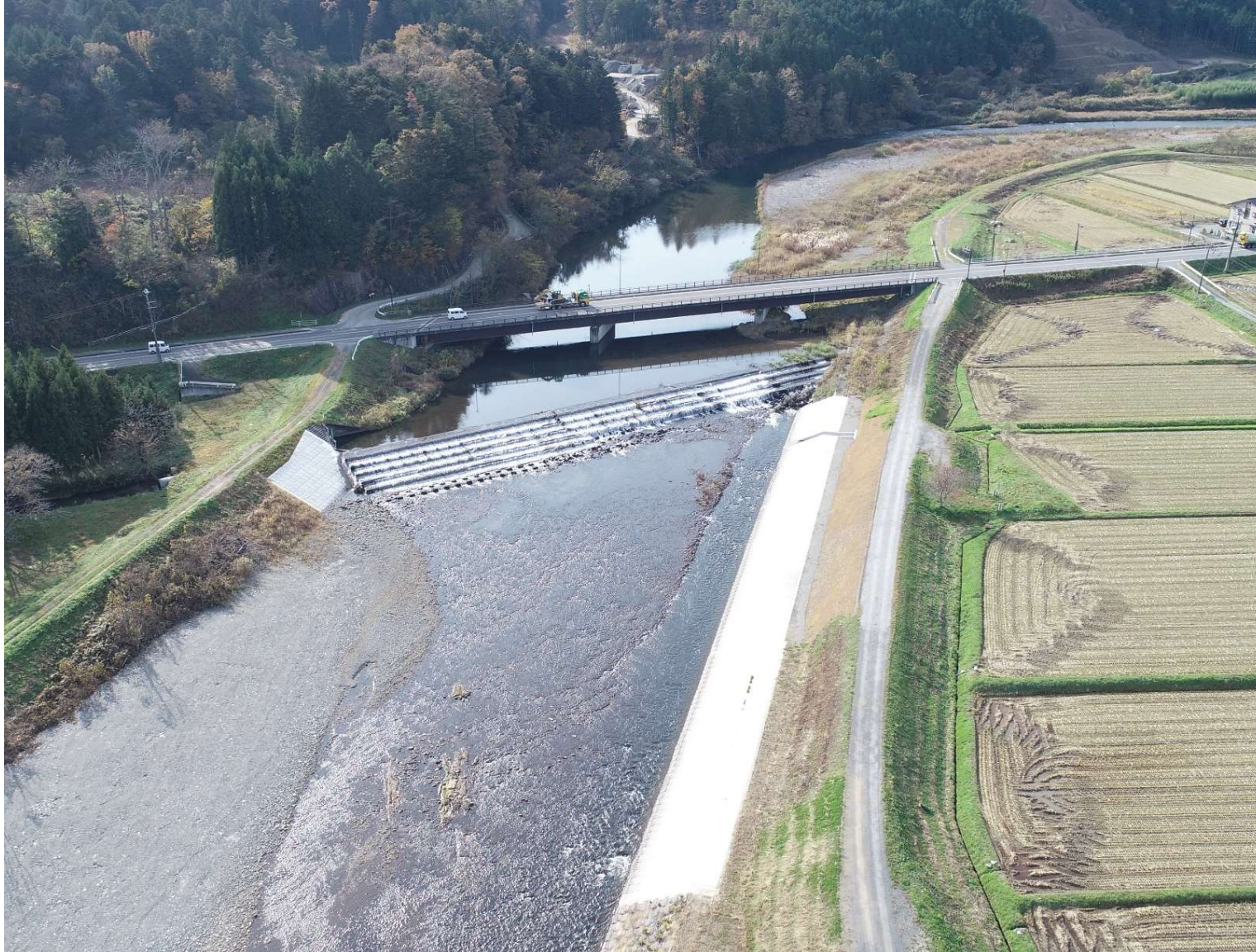
令和元年度台風19号被災箇所災害復旧箇所(新田川・南相馬市大原地内)