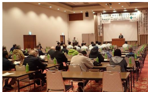
▲ 熱心に聴講する参加者