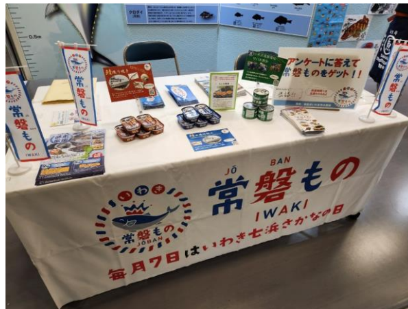
▲ 豊洲市場夢市楽座における常盤ものPRブース

——ちなみに、昨年のインタビューの際、趣味は家庭菜園と伺いましたが、現在もお変わりありませんか。