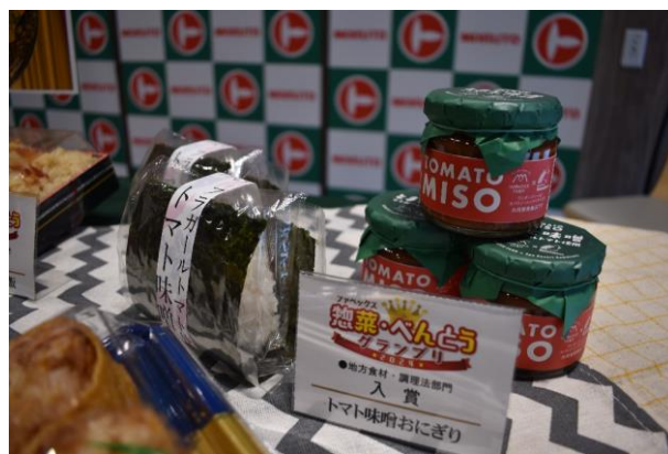
▲ トマト味噌おにぎり

ブランド米「Premium Iwaki Laiki」と福島県のトップブランド米「福、笑い」をブレンドしたマルトこだわりのおにぎりの具に、(株)ワンダーファームの6次化商品「とまと味噌」を使っています。ご飯と相性抜群のとまと味噌のおにぎり、美味しそうですね。今後も地元農林水産物を使った商品開発で、地域を盛り上げてほしいと思います。この度は受賞おめでとうございます。(企画部)