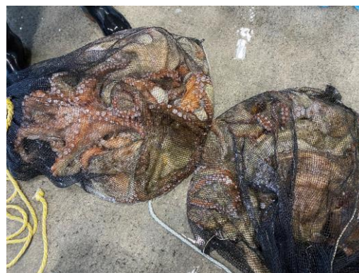
▲ カゴ漁業により漁獲されたマダコ

主な魚種は、底びき網漁業で「ヒラメ」「マアナゴ」「ヤナギムシガレイ」「キアンコウ」、釣り・さし網・カゴ漁業が「ヒラメ」「マダコ」などで、特に久之浜市場では、カゴ漁業で水揚げされたマダコが多く、大きなマダコが1トン以上も水揚げされました。これから順次、市内の量販店にも出回りますので、ヒラメやタコのお刺身、アナゴの天ぷら、アンコウ鍋など、冬の「常盤もの」を是非ご賞味ください。(水産事務所)