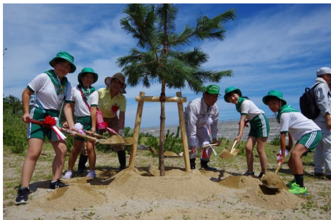
▲ 令和5年9月2日「第49回いわき市植樹祭」の様子

5つ目は「震災及び原子力災害からの水産物の復興」です。「常盤もの魅力アップ事業」により、ALPS処理水の海洋放出の影響も含めた風評の払拭や、販路拡大に継続して取り組んでいきます。