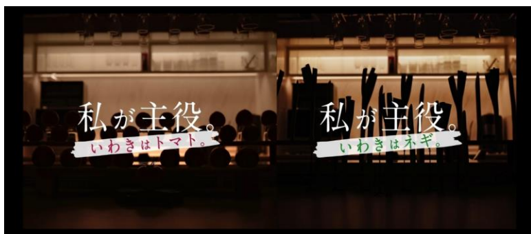
▲ いわき産農産物等プロモーション業務「私が主役。」プロジェクト 動画