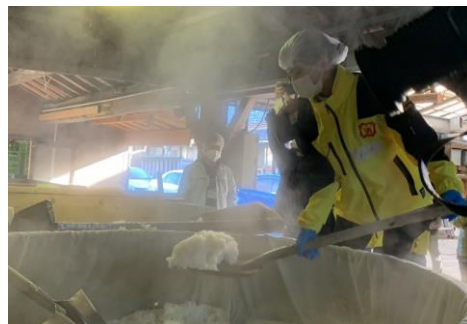
▲ 蒸米を掘って放冷機のベルトコンベアへ

また、今年5月頃から始まる「第7期活動」の参加者を、近日中に募集開始する予定です。次回の記事で案内予定ですので、ぜひご覧ください。(企画部)