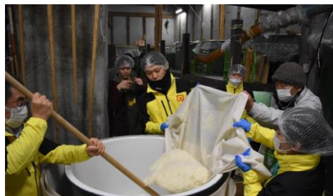
▲ 冷ました蒸米をタンクに投入