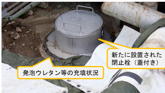
(写真2) マンホール部の状況②