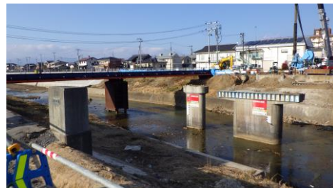
咲田橋の橋桁撤去後の様子