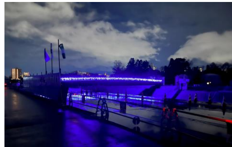
幕ノ内橋ライトアップの様子

なお、幕ノ内橋では昨年末から1月末まで、ライトアップを実施し、周辺景観の向上に取り組みました。