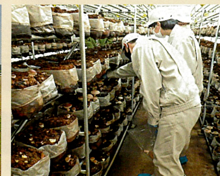
菌床しいたけの収穫体験 (1月31日 フレッシュ農業講座)