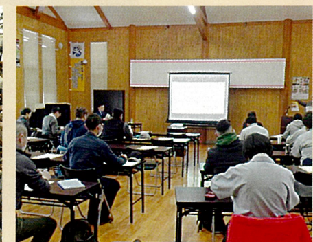
マーケティングに関する研修会 (2月8日 新規就農者等研修会)