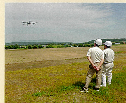
ドローンの操縦体験 (7月7日 フレッシュ農業講座)

就農を目指す皆さん、就農して間もない皆さんの課題や悩みは色々だと思いますが、一人で悩まず相談することが大事です。普及所には、各作物の専門技術者がいますので、いつでも相談してください。儲かる農業を実現するために、一緒に頑張りましょう。