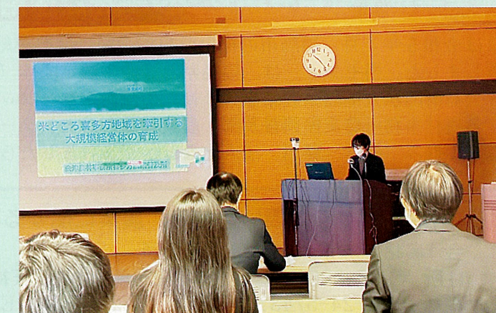
有賀技師による成果発表の様子