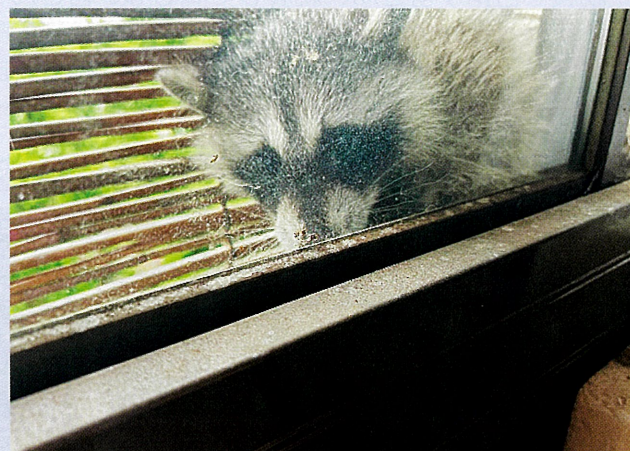
人家に出没するアライグマ