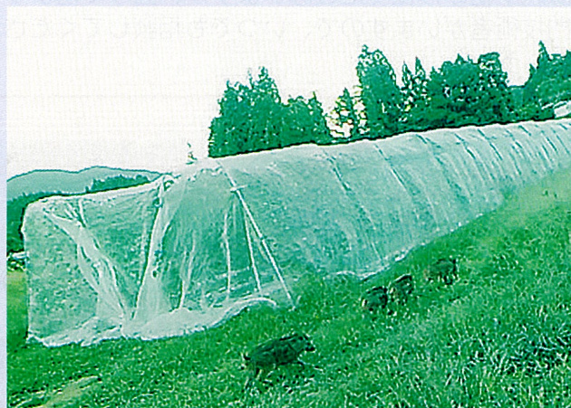
いんげん畑に出没するイノシシ

野生動物による農作物の被害対策の第一歩は、山林からの侵入経路や住処となる遊休農地等を無くすことです。まずは、環境診断を行い、営農場所の環境整備を行いましょ。そして電気柵等の防護柵で農作物を守り、最後に執着している加害獣の捕獲を行いましょ。