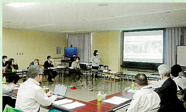
熱心に検討いただいた懇談会の様子

今後は、いただいた御意見等を令和6年度の普及指導計画等に反映させ、現場に則した的確な普及活動が展開できるよう努めて参ります。