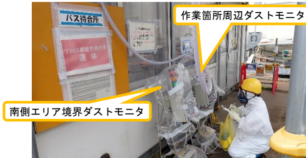
(写真5) ダストモニタの確認状況