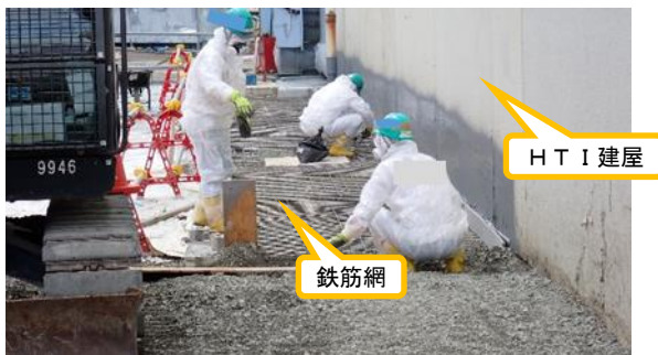
(写真 2 - 1) 鉄筋網等設置作業の状況① (北側から撮影)