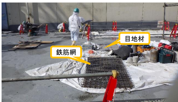
(写真 2 - 2) 鉄筋網等設置作業の状況② (東側から撮影)