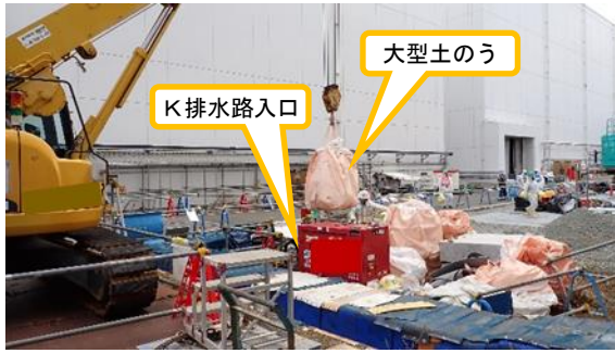
(写真4) 大型土のうの引き上げの状況 (北西側から撮影)