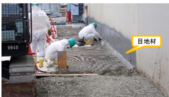
(写真 3) 鉄筋網等設置作業の状況③ (北側から撮影)