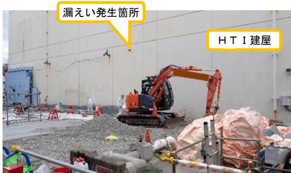
(写真 1) HT I 建屋東側の概観 (北東側から撮影)