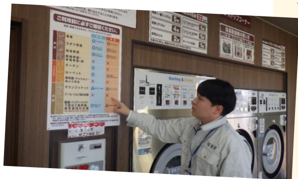
↑クリーニング営業施設の立入検査の様子

福島県で生まれ育った身として、故郷で人の役に立つ仕事がしたかったからです。人のために仕事をし、感謝されることでお互いの幸せに結びつき、それがまた新しい仕事へのモチベーションにも繋がると考えています。