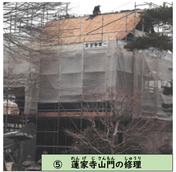
⑤ 蓮家寺山門の修理