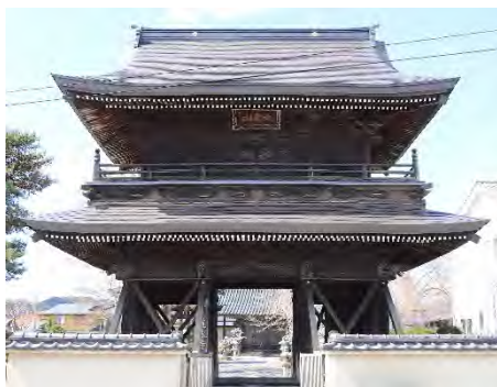
③ れんげじ 蓮家寺