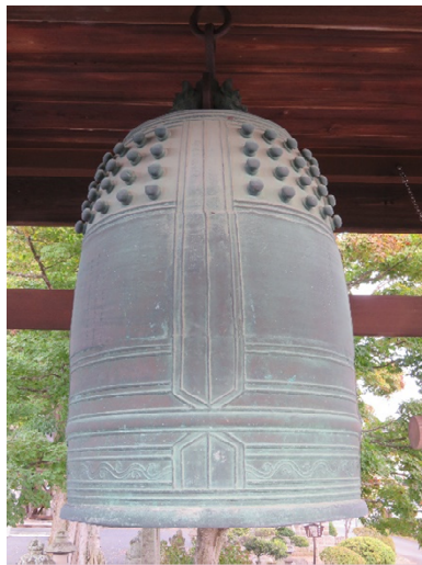
③ れんげじ どうしやう 蓮家寺の銅鐘

あかりさんたちは、 たなぐらまち 棚倉町にある文化財やれ きしあるまちなみについて調べ、わかったこと を話し合いました。