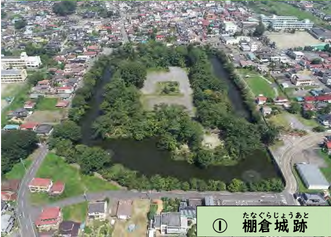
① たなぐらじょうあと 棚倉城跡