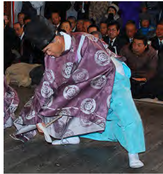
⑤ やつきつつこわけじんじゃ おたうえさい 八槻都々古別神社の御田植祭