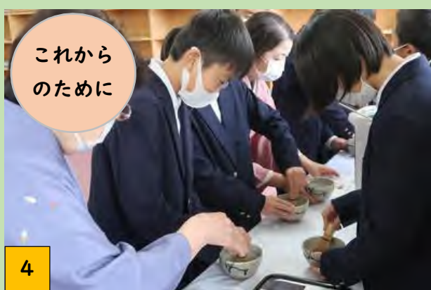
④ あかりさんたちがつくった4コマCM