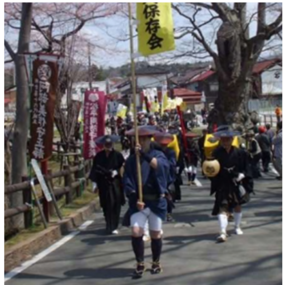
② じゅうまんごくたなぐらじょう 十方石棚倉城祭りの様子