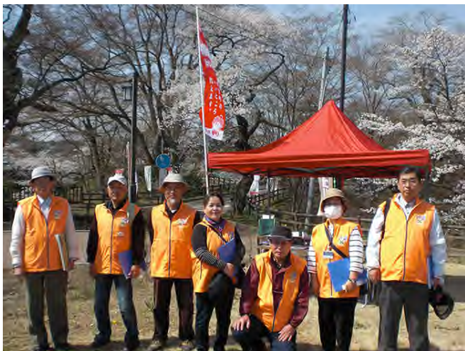
④ 棚倉町ふるさとガイド