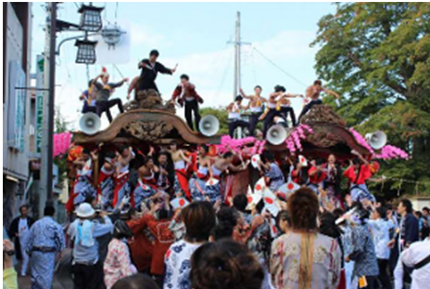
① たなぐら 棚倉秋祭りの様子