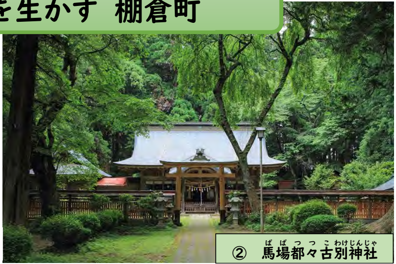
② ばばつつこわけじんじゃ 馬場都々古別神社