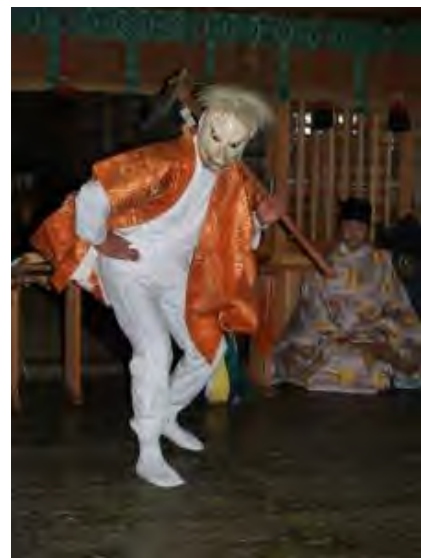
③ やつきつ つ こわけじんしゃ 八槻都々古別神社 おたうま の御田植

「近くにある小学校のクラブ活動では、 やつきつ つ こわけじんじゃがくじんかい 八槻都々古別神社楽人会の方から、昔か ら伝わる田遊びを学んでいるそうだよ。」