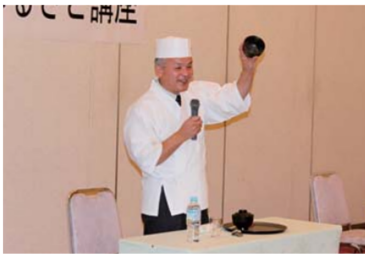
⑤ 棚倉ふるさと講座の様子