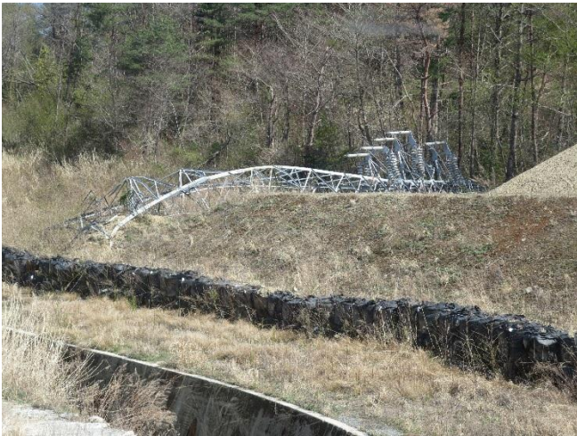
夜ノ森線鉄塔倒壊現場