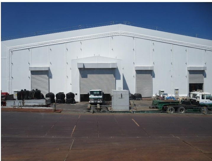
ALPS の入っている建屋を外か ら見た状況