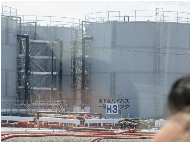
地下水バイパス一時貯留タンク