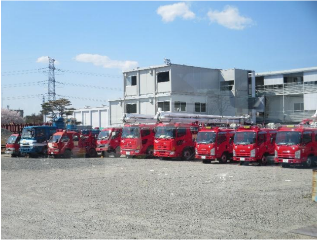
免震重要棟付近バックアップとして 消防車が配備されている