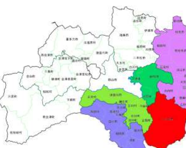
いわき管内発注隣接3管内