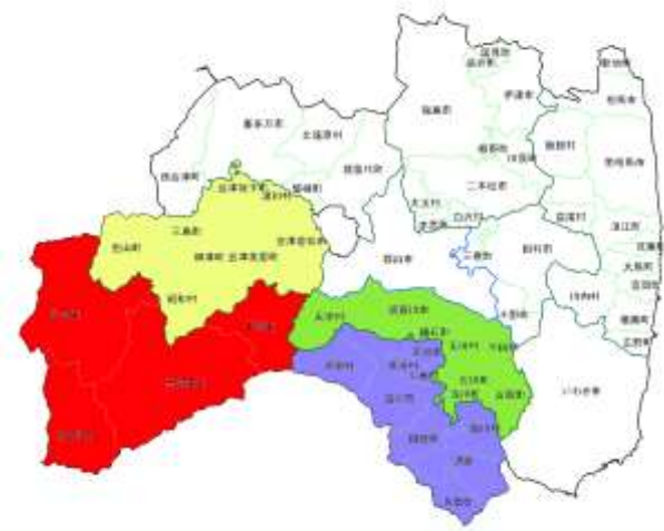
南会津管内発注隣接3管内