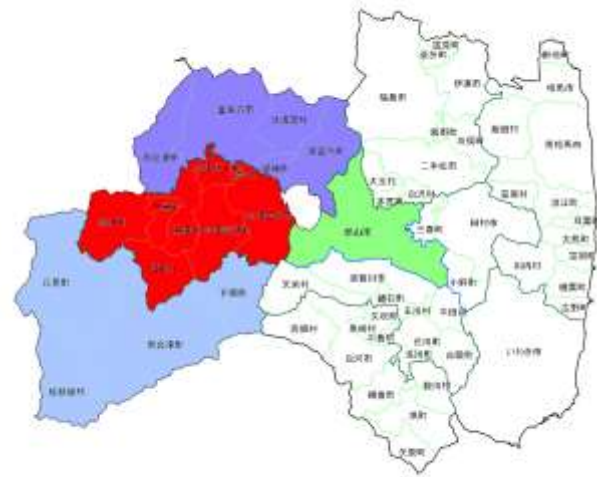
会津若松管内発注隣接3管内