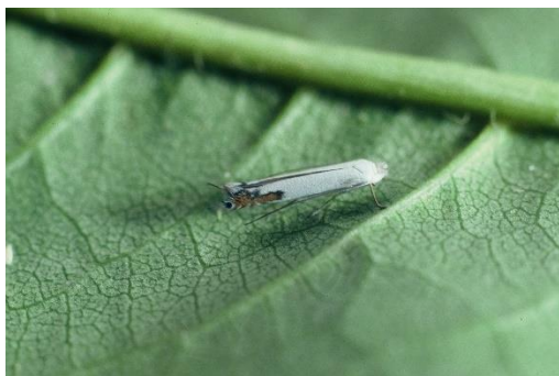
写真2 モモハモグリガ成虫