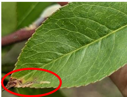
写真1 モモハモグリガの被害葉 （撮影：令和5年5月2日）

注) 登録内容は令和5年5月1日現在。希釈倍数・使用量の下線は試験研究成果に基づき、効果的な使用方法を示すものである。