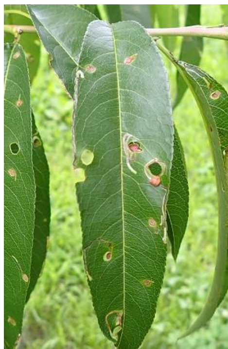
写真3 複数の寄生を受けたモモ葉

●情報内容への質問は、福島県農業総合センター安全農業推進部発生予察課（病虫害防除所）まで御連絡ください。