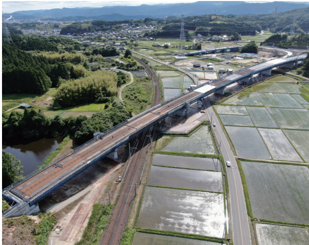
ふくしま復興再生道路（小名浜道路）

さらに、地域の課題を解決し、地域活性化を図るための基盤として、5Gを始めとした携帯電話基地局や光ファイバなどのデジタルインフラを着実に整備していく必要があります。