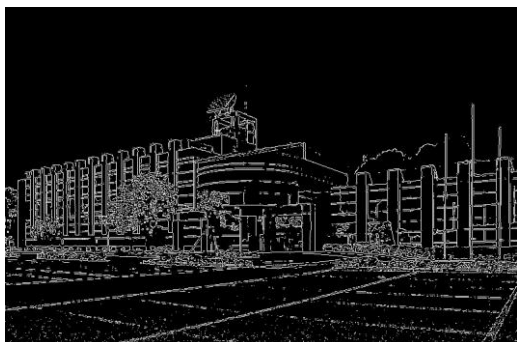
図4 画像処理の結果