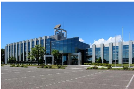
図3 画像処理対象の画像

エッジ検出では、Canny 法の2つのパラメータを調整する。いずれもエッジを検出するための閾値であり、値を小さくするとよりエッジを検出しやすくなる。調整の方針としては、1つ目の小さい閾値 (Min) で、エッジらしい部分を検出し、2つ目の大きい閾値 (Max) で確実にエッジとなる部分を検出する。最終的な結果は2つの閾値で検出された部分がつながる線をエッジとして出力する。図3に画像処理する対象のサンプル画像を、図4に支援ツールで実装された二値化を除くすべての画像処理アルゴリズムを適用した結果を示す。