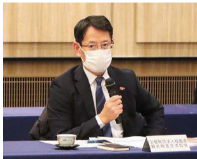
国、東京電力に意見を述べる構成員(各団体代表)

国や東京電力が行っている情報発信の取組について、情報発信を行うことと相手方に情報が届いていることは別の話である。