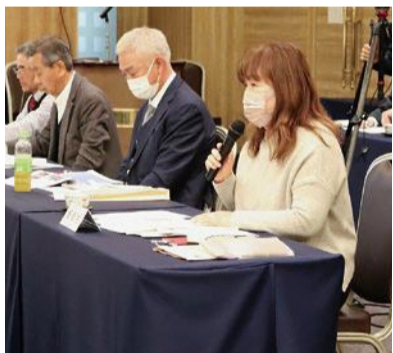
国、東京電力に質問をする構成員(住民代表)

能登半島地震で不安が高まっている。震災を思い出して備えなければという気持ちでいっぱい。津波対策など住民にアピールしてほしい。(意見部分のみ抜粋)