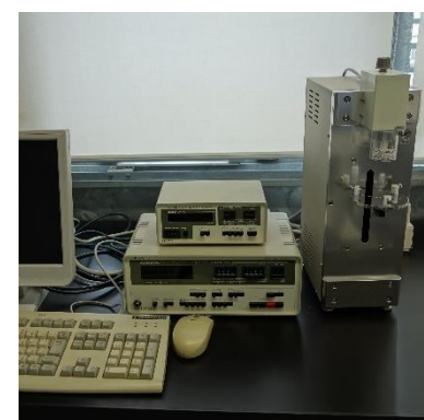
レオメーター (990円/時間)

○その他の施設・設備は、福島県ハイテックプラザ 施設・設備データベースからご覧いただけます。