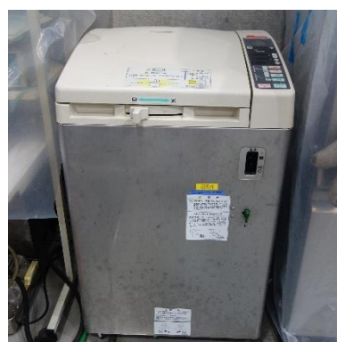
小型高温高圧調理殺菌機 (740円/時間)