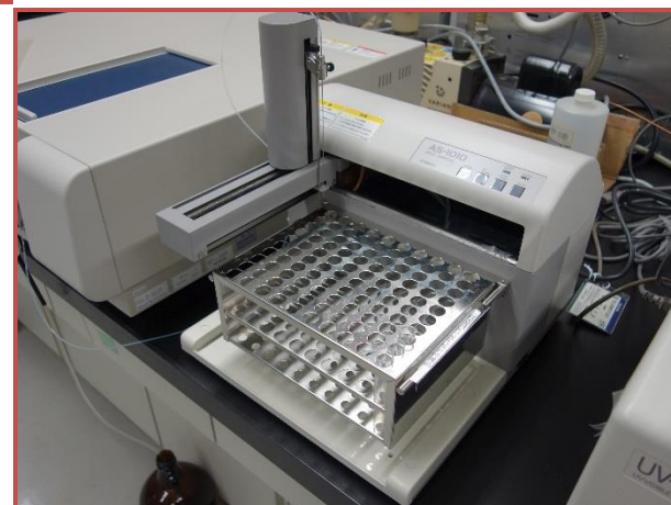
オートサンプラによる連続自動分析