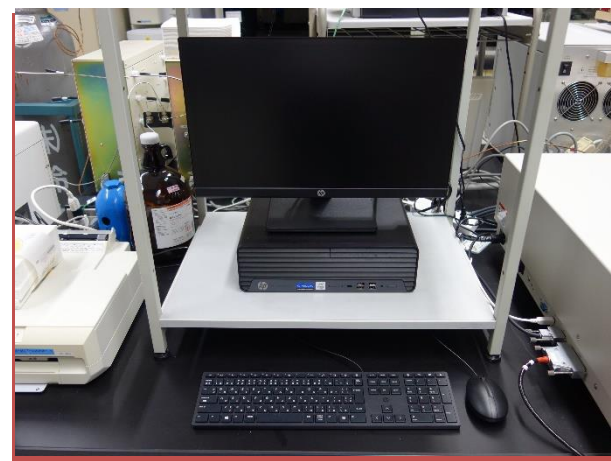
PCによる装置の制御・データ処理