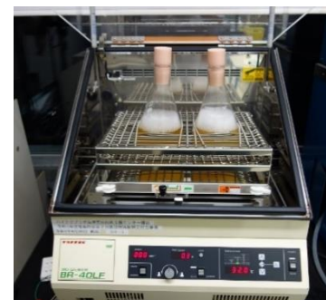
恒温振とう培養器 (320円/時間)

○その他の施設・設備は、福島県ハイテックプラザ 施設・設備データベース からご覧いただけます。