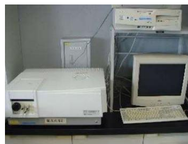
分光蛍光光度計 (1,040円/時間)