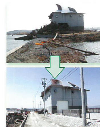
完成した相馬排水機場(相馬市)