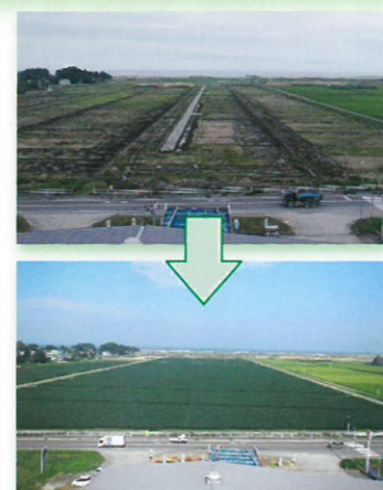
一部営農再開! 作田前地区(新地町)