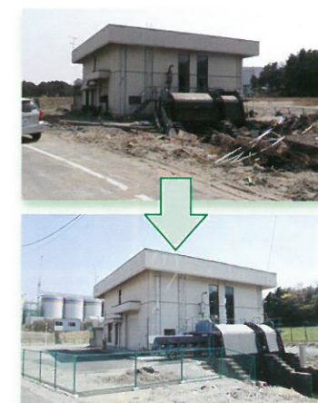
完成した今泉排水機場(新地町)

●復旧の状況などは、福島県農村計画課のホームページに掲載の「農空間」でもご覧いただけます。