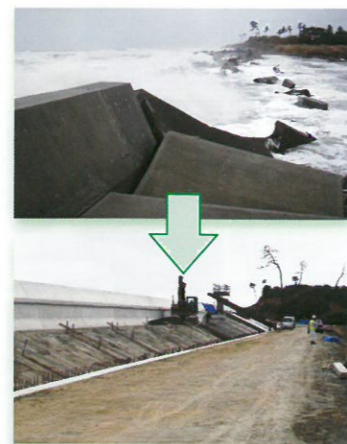
工事が進む北海道海岸(南相馬市)