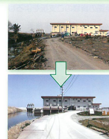
完成した柏崎排水機場(相馬市)