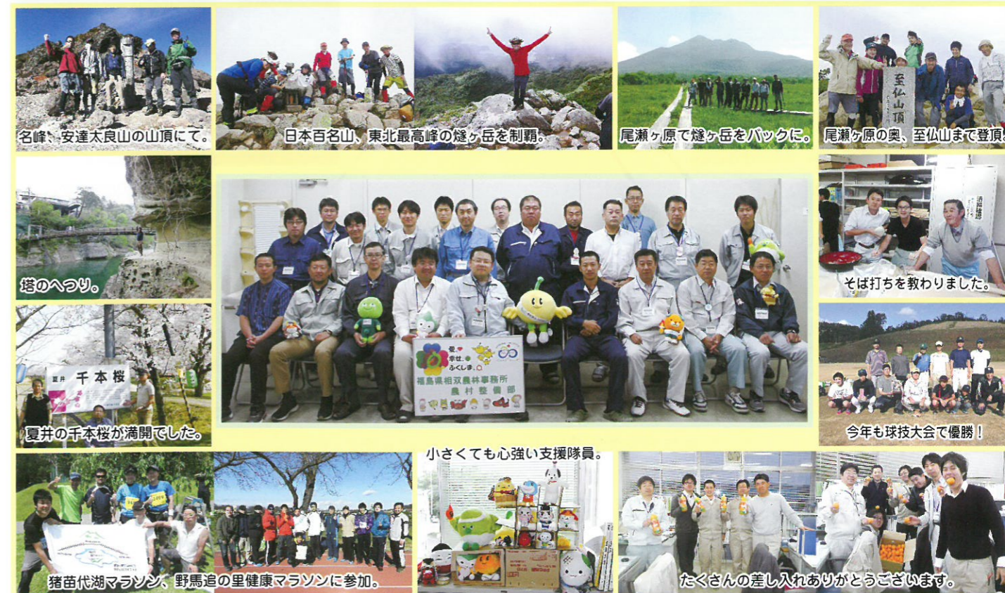
名峰、安達太良山の山頂にて。