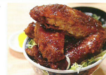
会津のソースカツ丼

A4. 福島県や他県職員とともに福島復興支援に携ったことと皆さんに出会えたことに絆を感じます。これからも忙しい日々が続くと思いますので、くれぐれもお体をご自愛ください。愛媛県福耕支援隊は出来る限り応援します。「福島県を一人ぼっちにはしません！」