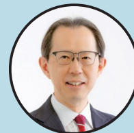
内堀 雅雄 知事