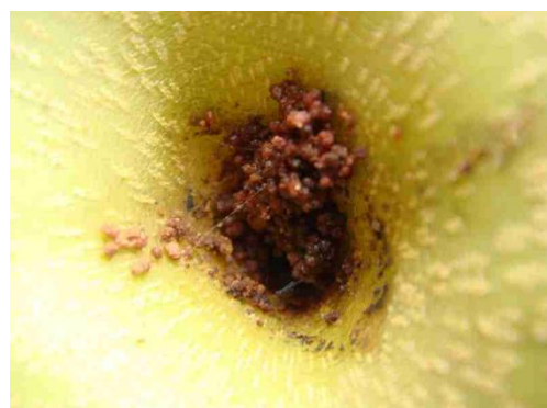
写真2 ナシ被害果から噴出した虫糞