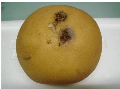
写真1 ナシヒメシンクイによるナシ果実被害