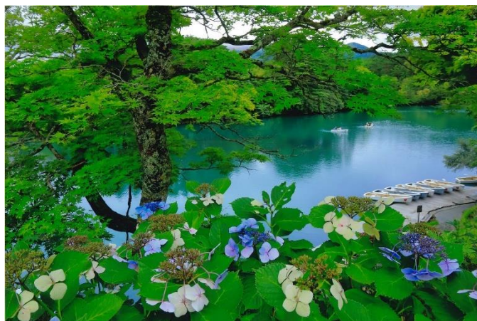
毘沙門沼 (猪苗代湖・裏磐梯湖沼フォトコンテスト入賞作品)