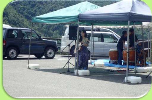
アコースティックライブ生演奏♪