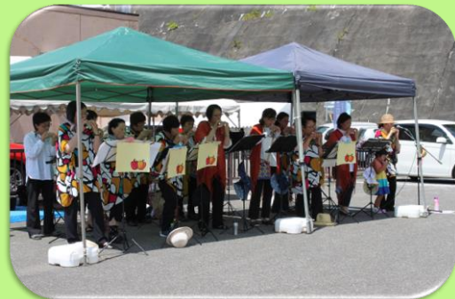
素敵なオカリナの生演奏♪