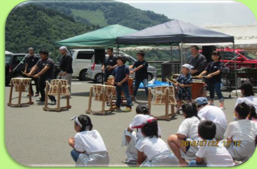
迫力の和太鼓演奏♪