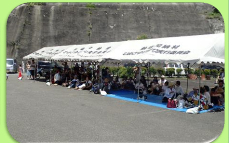
大勢の方にライブを楽しんでいただきました♪