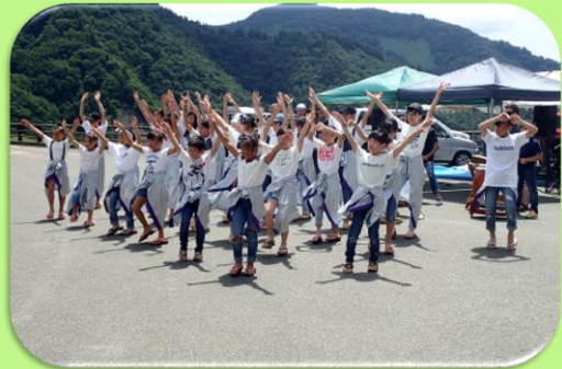
暑さにも負けない! ダンスパフォーマンス♪