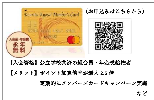
公立共済メンバーズカード(クレジットカード)