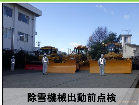
除雪機械出動前点検