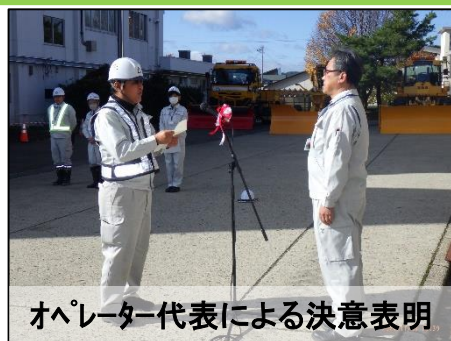
オペレーター代表による決意表明