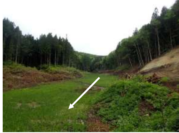
整備前の堰堤予定地