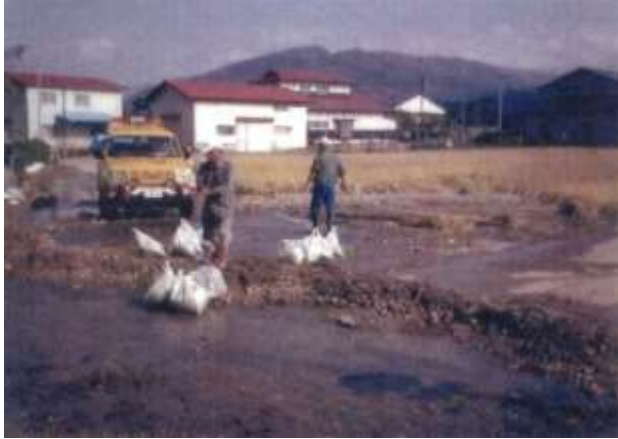
平成16年7月新潟・福島豪雨での被災状況