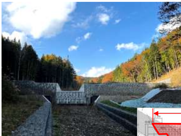
完成した砂防堰堤